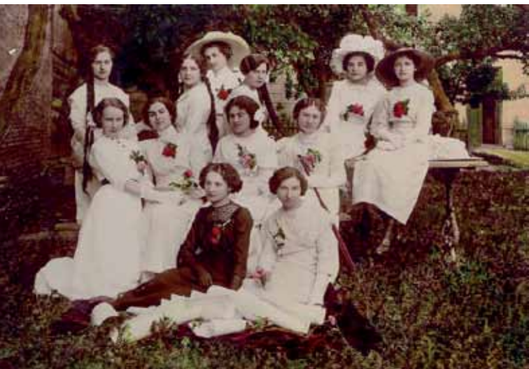
Pierwsze maturzystki z 1912 r.