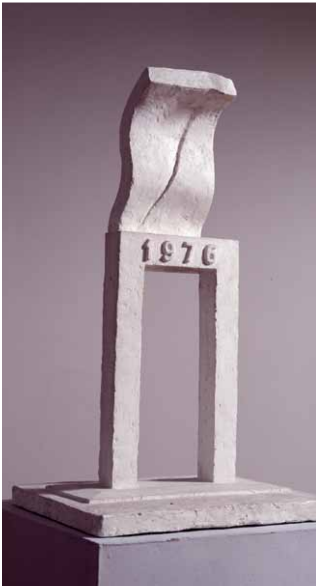
Maciej Szańkowski, Powiew - Projekt pomnika Radomskiego Czerwca 1976, 1981, gips, 77 x 45 x 38,5 cm, kolekcja Muzeum Sztuki Współczesnej w Radomiu, dar Artysty

Rynek 4/5 (Dom Esterki i Dom Gąski) tel. 48 362 25 50 fax 48 362 34 81 www.muzeum.edu.pl mws@muzeum.edu.pl