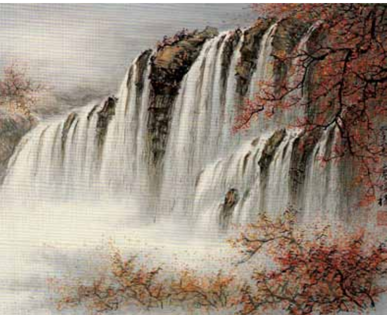
aut. obrazu Liao Ci Fu

Wystawa zorganizowana z okazji 100. rocznicy utworzenia Republiki Chińskiej na Tajwanie