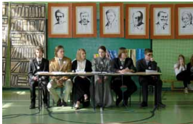
Finał Konkursu Wiedzy o Polskich Noblistach dla uczniów szkół podstawowych klas IV–VI. Edycja – 2010.

Organizator: Publiczne Gimnazjum nr 13 z Oddziałami Dwujęzycznymi im. Polskich Noblistów ul. 25 Czerwca 79