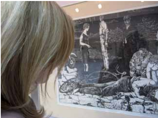
Z cyklu „Rowerzysta” Mieczysława Wejmana z kolekcji Muzeum Sztuki Współczesnej w Radomiu.