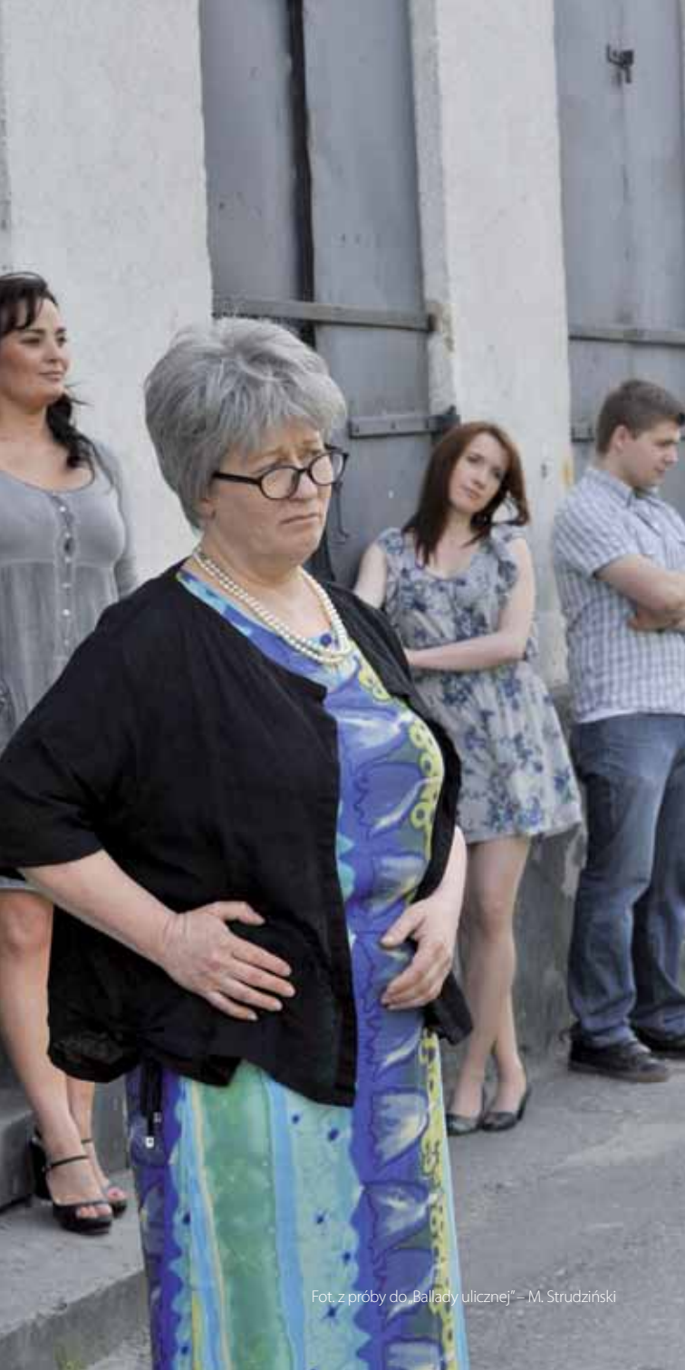
Fot. z próby do „Ballady ulicznej” – M. Strudziński

Plac Jagielloński 15 tel. 48 384 53 22 fax 48 384 53 07 www.teatr.radom.pl teatr@teatr.radom.pl bilety@teatr.radom.pl