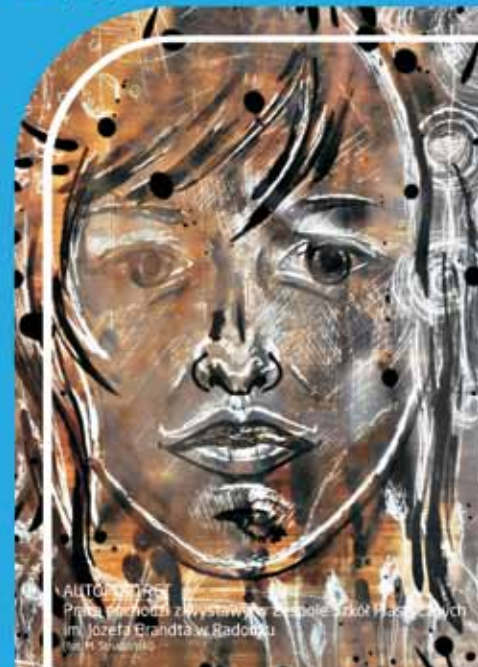
WALTOREK Praca z r. 2009 z wystawy "Zdobiele Szkoł Mistrzów im. Józefa Brandta w Radomiu"