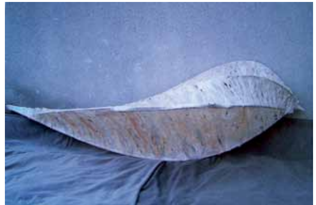
Moby Dick, 2009, technika własna: bambus, włókno naturalne, 75x285x90 cm

Mieszka i pracuje w Legnicy. Ukończyła Państwowe Liceum Sztuk Plastycznych w Jeleniej Górze i Wyższą Szkołę Sztuki Stosowanej w Poznaniu (dyplom z wyróżnieniem na kierunku malarstwa ze specjali-