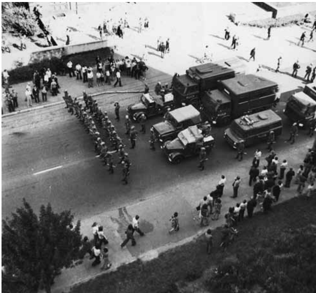
Zdjęcie z 1976 roku udostępnione przez IPN