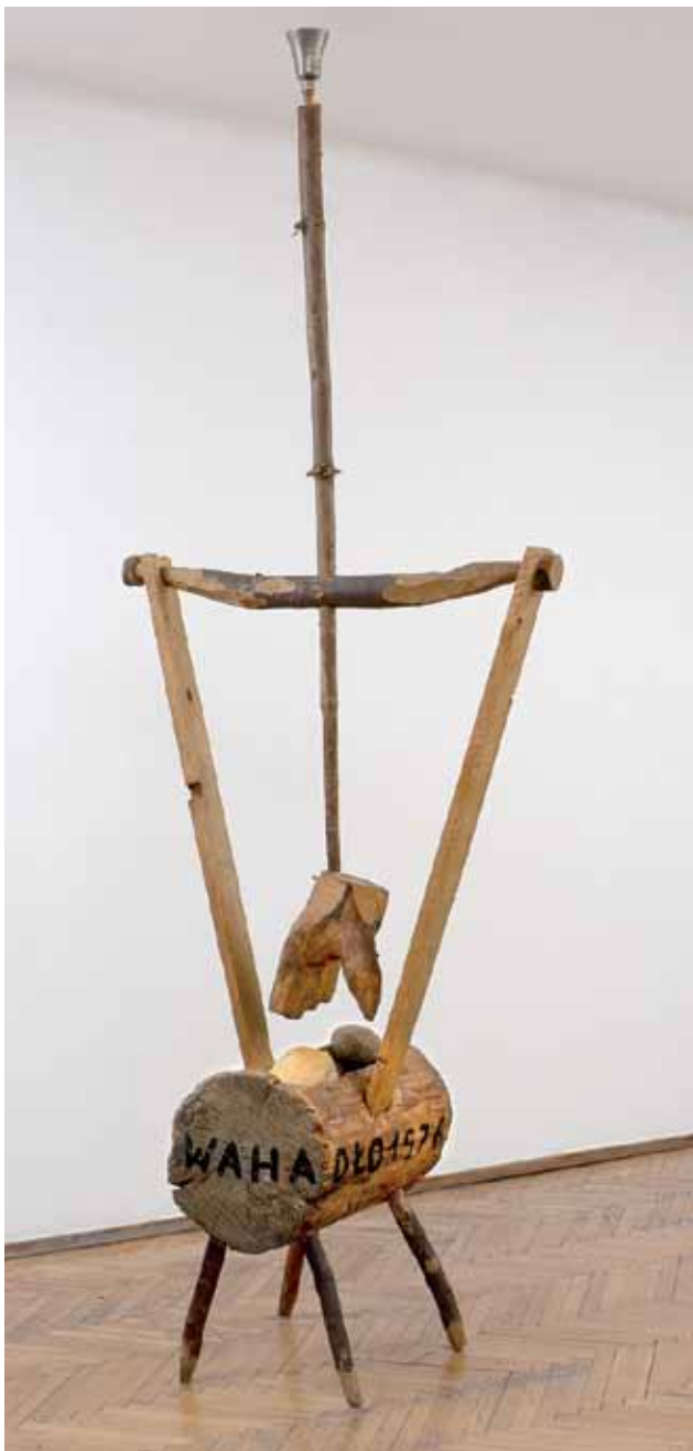
Jerzy Beres, Wahadlo, 1976, drzewo, metal, kamień, chleb, wys. 260 cm, kolekcja Muzeum Sztuki Współczesnej w Radomiu, dar Artysty, fot. Marek Gardulski