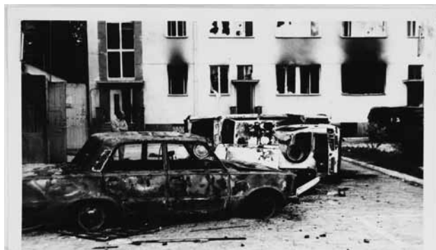
Zdjęcie z 1976 roku udostępnione przez IPN

I strefa - bilet normalny 19 PLN bilet ulgowy 16 PLN II strefa - bilet normalny 13 PLN bilet ulgowy 11 PLN Karnet w I strefie na 5 wybranych koncertów 60 PLN