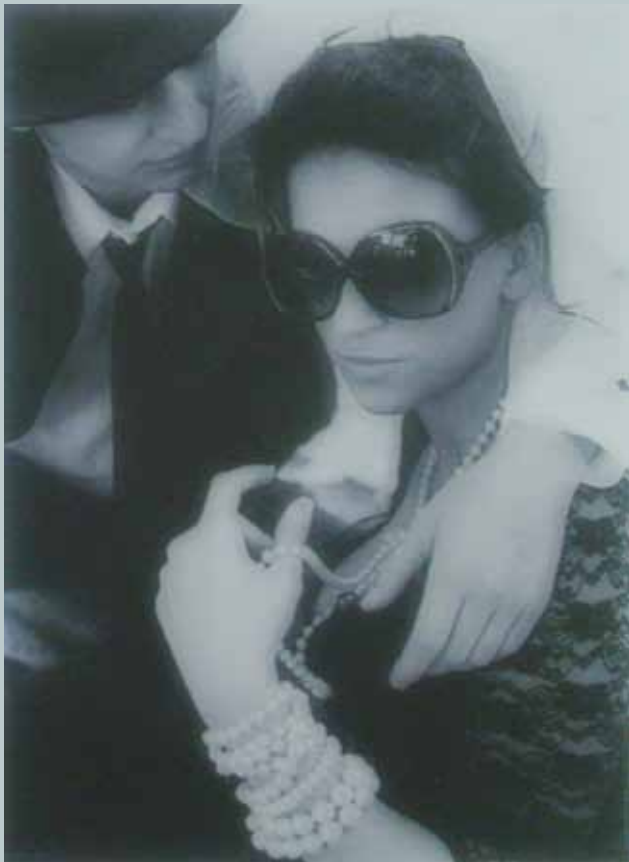
aut. K. Pogodzińska

Miejska Biblioteka Publiczna działa od 1922 r. Obecnie, oprócz 6 agend w budynku głównym, ma 14 filii na terenie miasta, zbiory liczące około 420 tys. woluminów, z których korzysta ponad 25 tys. czytelników zarejestrowanych i prawie 75 tys. osób w czytelnich. MBP wdraża Mazowiecki System Informacji Bibliotecznej, zajmuje się opracowaniem bibliografii regionalnej dla obszaru byłego województwa radomskiego, prowadzi także działalność wydawniczą oraz szeroką działalność z zakresu promocji czytelnictwa. Od 2009 roku tworzy Radomską Bibliotekę Cyfrową, dzięki której do światowych zasobów informacji trafiły elektroniczne wersje książek i czasopism regionalnych. W tej chwili internauci mają dostęp do ponad 4500 publikacji wydanych do 1945 r., a przechowywanych w zbiorach MBP i Archiwum Państwowego w Radomiu. Skorzystało z nich ponad 220 tysięcy użytkowników na całym świecie. Najchętniej oglądali oni album „Widoki Radomia” wydany w 1899 r.