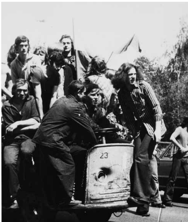
Zdjęcie z 1976 roku

Na wystawie wyeksponowane zostaną stare zdjęcia, klisze fotograficzne, logotypy funkcjonujących wówczas organizacji oraz przedmioty codziennego użytku. Założeniem ekspozycji jest przybliżenie atmosfery lat siedemdziesiątych ubiegłego wieku a zarazem dostarczenie informacji nt. nieistniejących zakładów pracy, stowarzyszeń i ugrupowań młodzieżowych.