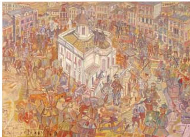
Edward Dwurnik, Cykl IX Podróże autostopem, Nr 25 Radom'76, 1978, olej, płótno, 150 x 210 cm, kolekcja Muzeum Sztuki Współczesnej w Radomiu