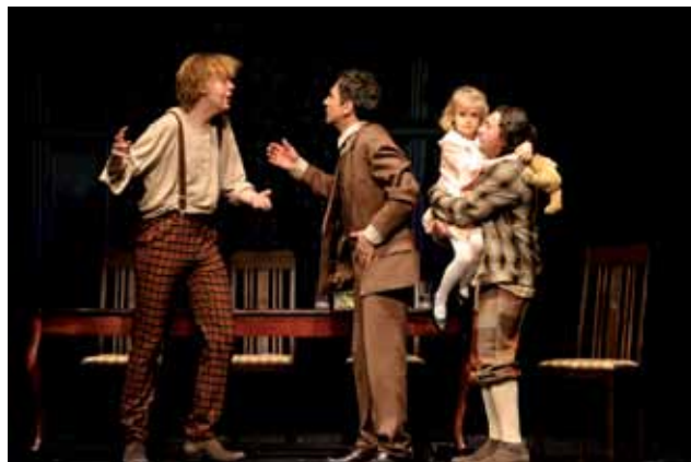
fol. K. Strudziński